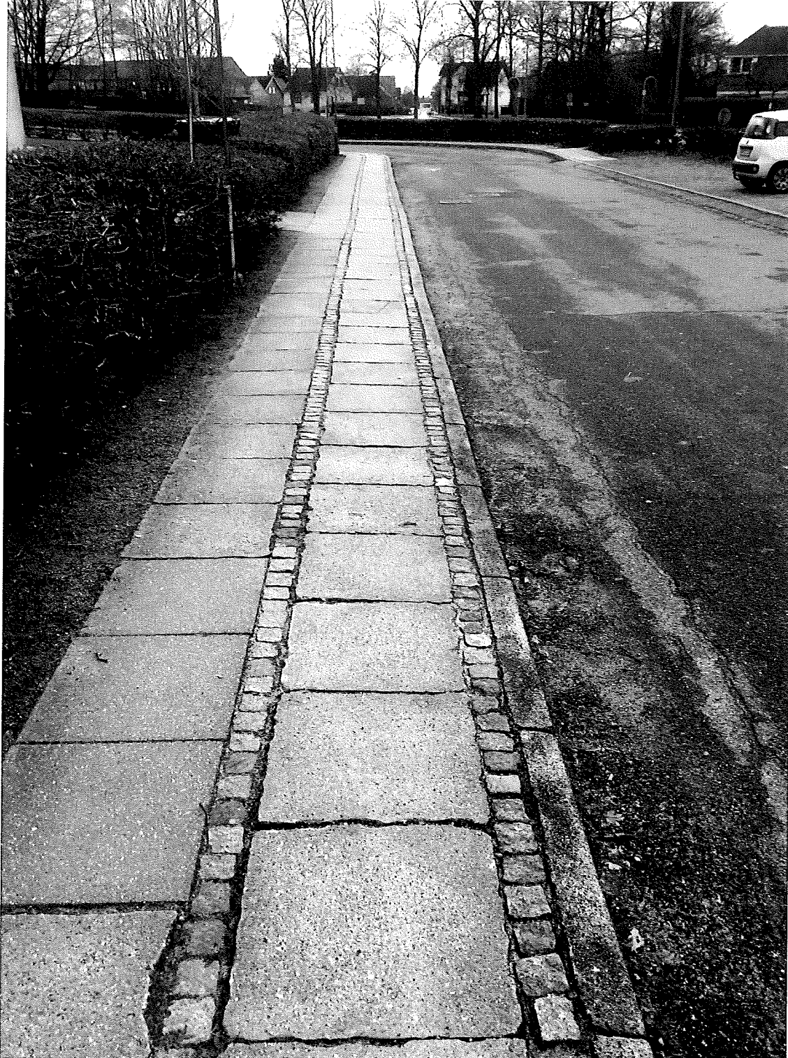
Billede vedr. kantskader/fugemateriale