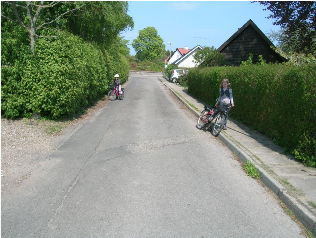
Eksempel 2. Trafikklasse T1 Restlevetid: 29 %