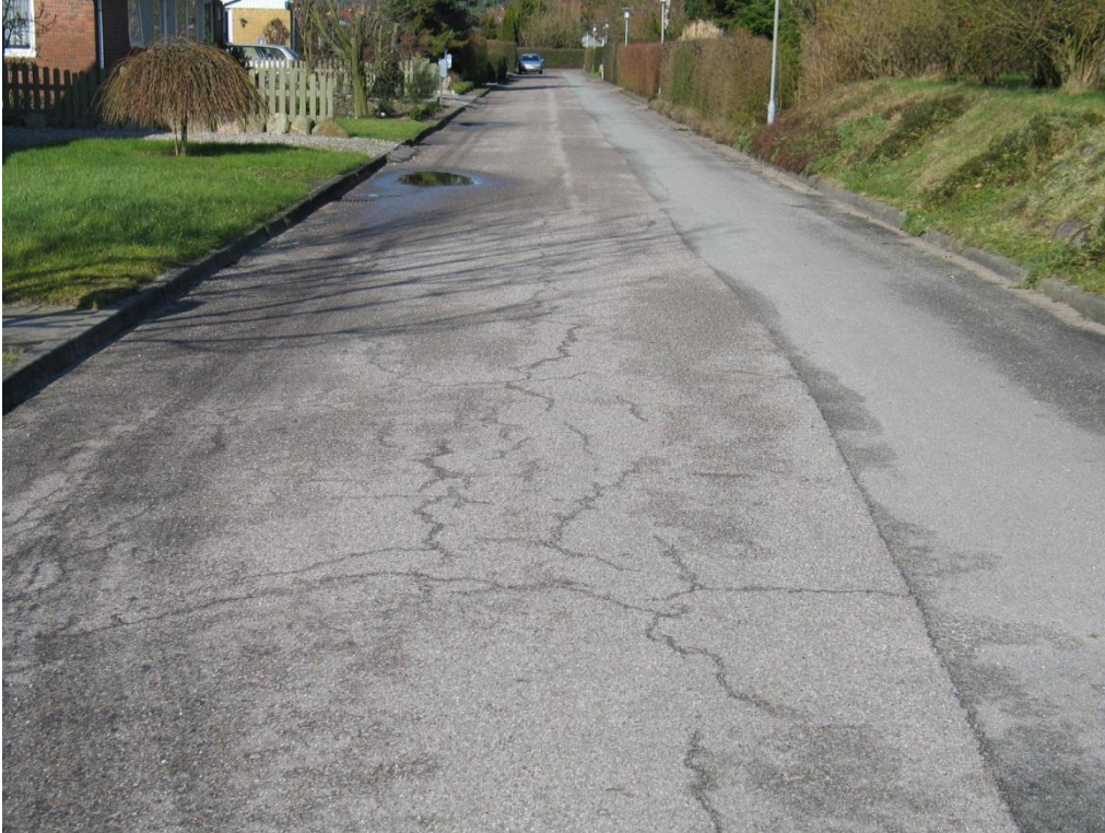
Eksempel 1. Trafikklasse T2 let Restlevetid: 33 %